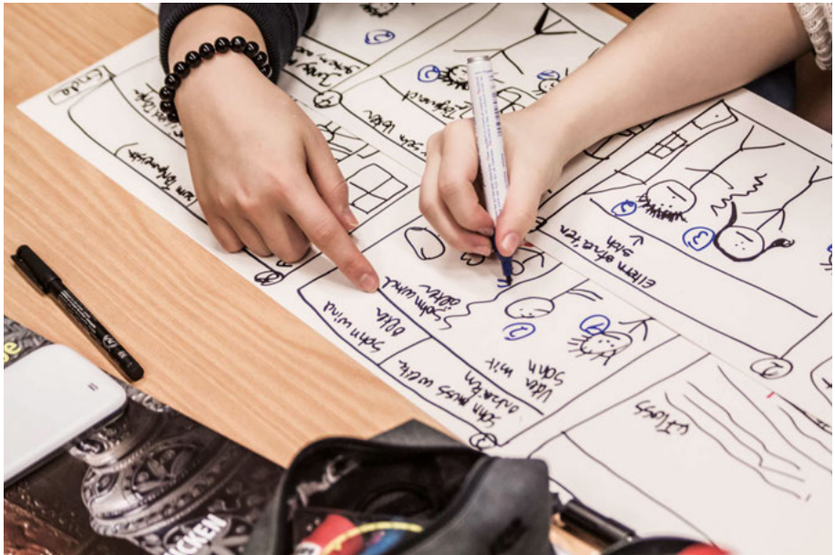
Abb. 4 Im Rahmen eines Workshops beim Institut für digitales Lernen wird für die Produktion eines multimedialen Museumsführers ein Storyboard erstellt.

Wie beim optischen Erscheinungsbild ist auch beim Geschichtenerzählen das Gesamtkonzept der Ausstellung bzw. des Museums zu beachten. Hier ist ein Textkonzept hilfreich, das Sprachstil und Sprachniveau für alle Bereiche festlegt, von den Wandtexten über den Katalog bis hin zu den digitalen Medien und den Online-Auftritt.