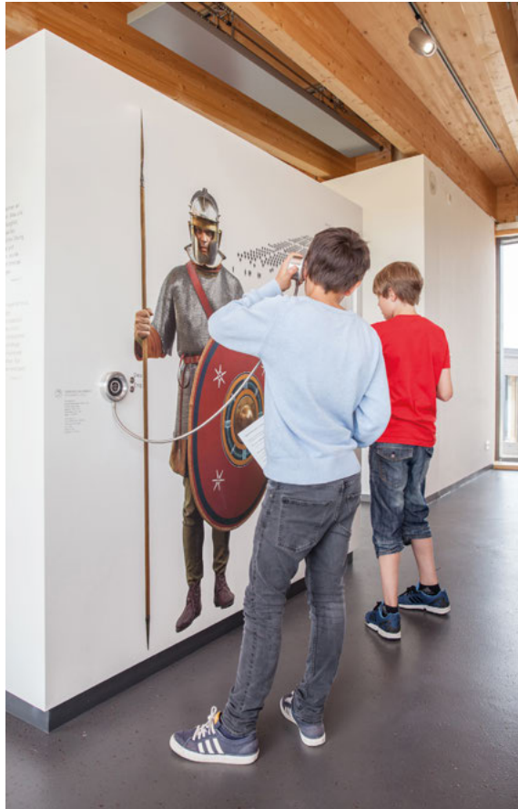
Abb. 3 Zentrale Figur des Storytelling-Konzepts im Limesseum in Ruffenhofen. Zentrale Figur im gesamten inhaltlichen und grafischen Vermittlungskonzept ist hier der inschriftlich auf einem ausgestellten Helmblech belegte Reitersoldat December.

Die beispielhafte Umsetzung eines Digital-Storytelling-Konzepts im Museumsbereich zeigt das Limesseum in Ruffenhofen. Zentrale Figur im gesamten inhaltlichen und grafischen Vermittlungskonzept ist hier der inschriftlich auf einem ausgestellten Helmblech belegte Reitersoldat December. Von diesem ist außer dem Namen und der ungefähren Lebenszeit um 200 n. Chr. nichts weiter bekannt. In einem im Museum gezeigten Film erhält dieser Soldat nun eine fiktive Lebensgeschichte, die auf der aktuellen Kenntnis des römischen Militärdiensts beruht. Durch die zentrale Szene im Film, in der December seinen Namen in ein Helmblech punzt, werden das reale Fundobjekt und die mediale Vermittlung miteinander verknüpft. Dieses »personalisierte Storytelling« ermöglicht es den Besuchern, über die subjektive Darstellung der historischen Person eine unmittelbare Verbindung zur antiken Lebenswelt herzustellen (vgl. Kap. 7.2.1).